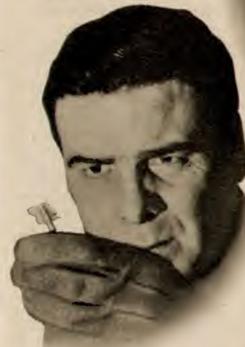
Dieser Schlüssel soll für Aldo und Nick der Schlüssel zum Reichtum werden

den Nägeln brennt, den Raub in Sicherheit zu bringen. Das harmonische Familienleben der Donatis macht auf Aldo tiefen Eindruck. Inzwischen hat Donati entdeckt, was Aldo getan hat. Er macht dem jungen Mann klar, daß er sich mit seiner Tat selbst aus der menschlichen Gesellschaft ausgeschlossen hat. Von Reue getrieben, kehrt Aldo zurück und legt das Geld dahin, wo er es genommen. Aber jetzt taucht Nick auf. Er will seinen Anteil. Nick schlägt Aldo nieder und flieht durch ein Fenster. Er verliert den Halt, stürzt in die Tiefe und bleibt zerschmettert liegen. Aldo beginnt ein neues, besseres Leben.